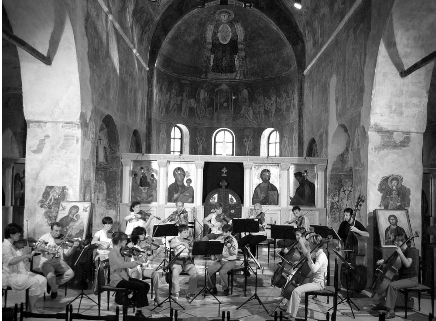
A MÁV Szimfonikus Zenekarból alakult kamaraegyüttes