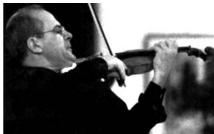
máig is elnöke a versenyt rendező alapítványnak. 1990 óta az esseni Folkwang Főiskola hegedű professzora.

Sajnos én a helyzetet elég pesszimistán látom. Az iskolának nagy szerepe van abban, hogy a gyerekek és fiatalok megszeressék a zenét. Úgy látom, hogy ez alacsony fokon vesztett jelentőségéből. Ez igen sajnálatos. A zenére specializált általános-