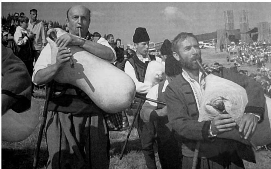
Bolgár zenészek tradicionális rubában egy folklór fesztiválon a Rozben hegységben Dél-Bulgáriában

Általában jól. Igen pozitívan hat az, hogy a bolgár muzsikusra bizonyos területeken az EU-normák és jogszabályok vonatkoznak. Ezek ugyan sokszor egészen kis ügyek, de mégis világossá teszik, hogy mi a zenekari területen jó úton haladunk. Számunkra Németország a példa, ami a munkafeltételeket, a professzionális zenekarokat illeti, és azon munkálkodunk, hogy minél többet megtudjunk. Ehhez azonban még intenzív szakmai cserelehetőség is szükséges, különösen menedzser- és know-how viszonylatban.