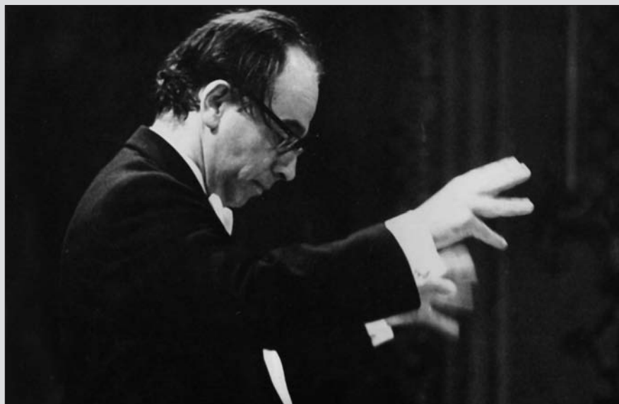
Archív kép a '80-as évekből