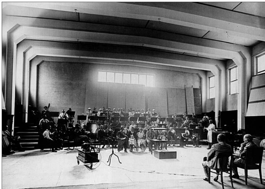
A 6-os stúdió akusztikai próbáin Dohnányi Ernő és Békésy György

Döntő jelentőségű, hogy nagyszerű muzsikusok irányították a zenei programokat: elsőként Kern Aurél, majd 1931-től Dohnányi Ernő – megnyerve a hazai előadóművészi élet színe-javát, és bemutatva a magyar zene romantikus alkotásait éppúgy, mint az új hangját kereső fiatal zeneszerző nemzedék legfrissebb termését. Szinte valószínűtlenül nagy a mindennapi élő adásokban pár esztendő alatt foglalkoztatott muzsikusok száma, a legjelentősebb művészekről a szórakoztató zenei műfajok képviselőiig, szimfonikus zenekarainktól, hivatásos kórusainktól és öntevékeny dalárdáinktól a legkülönbözőbb kamaragyűjtéseken át a divatos szalonzenekarokig.