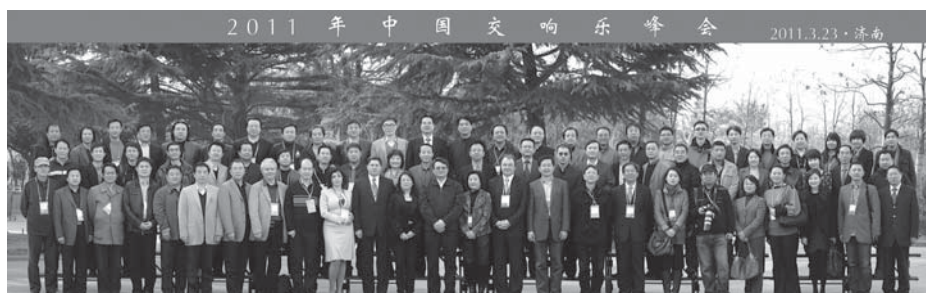
A konferencia csoportképe