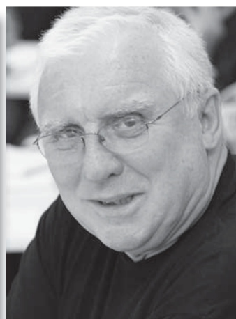
Baross Gábor Szegedi Szimfonikus Zenekar