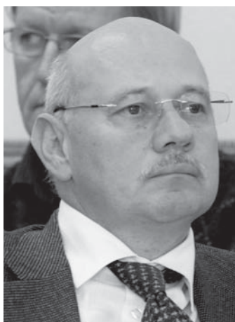
Ignác Ervin Szobnoki Szimfonikus Zenekar

– Az előadó-művészeti törvény alapján is van lehetőség arra, hogy kiemelt módon támogatassanak olyan együtteseket, amelyek az átlagostól eltérően szerveződnek. Jó példa erre a Budapesti Fesztiválzenekar, amely nem intézményként működik, nem is önkormányzat által fenntartott, hanem egy magánalapítvány, s a fővárosi önkormányzat támogatási szerződése és a miniszterrel kötött, közszolgáltatási támogatási szerződés alapozza meg költségvetését, működési feltételeit. Ha támogatni akar a kormány, arra számos egyéb lehetősége van: pályázati utak, közszolgáltatási szerződéssel, feltételrendszer teljesítése alapján. Mindig a miniszter szakmai felelőssége, pénzügyi lehetősége, hogy vállalkozik-e erre. Van egy másik sávja ennek, ami nem az előadó-művészeti törvény kérdése, hanem magyar munkajogi kérdés. Kérdés, meddig vállalkozás, megbízás egy jogviszony és mikor válik ösztönözte a vállalkozásokat, amelyek ezen a területen főképp kényszervállalkozások.