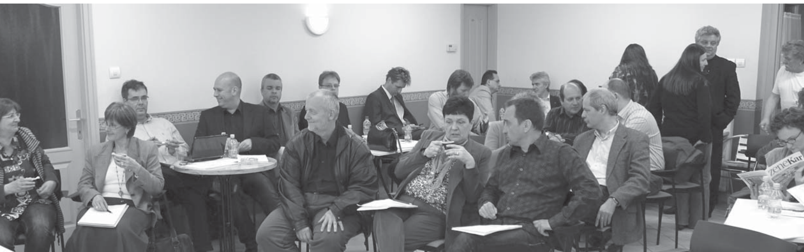
Munkáltatók és munkavállalók cserélik ki gondolataikat az Előadó-művészeti Törvényről