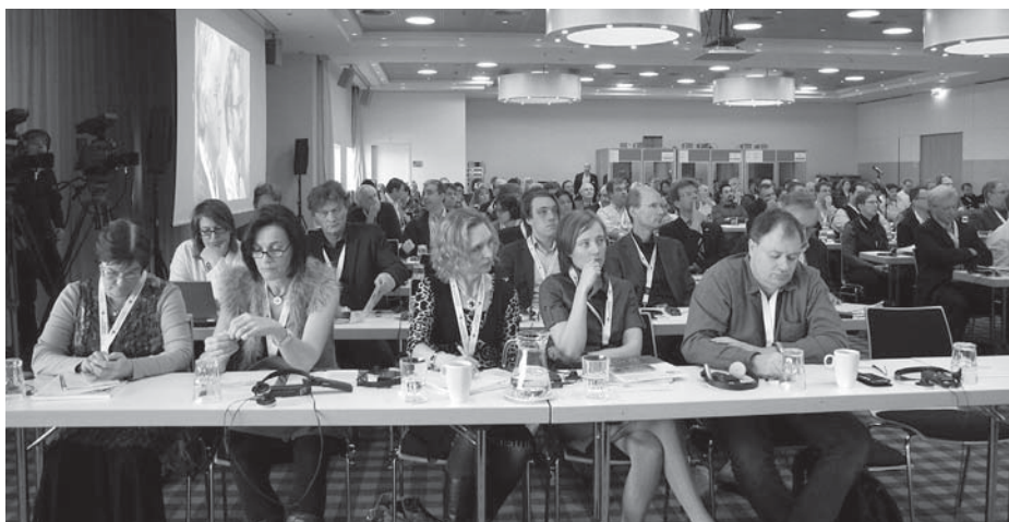
Pillanatkép a konferenciáról

– Így igaz, s a munkaszerződésekkel kapcsolatban több, mint különös volt arról hallanom, hogy ahol nem közalkalmazotti vagy hosszú távú szerződéssel foglalkoztatják a zenészt, ott is az úgynevezett önfoglalkoztató forma dívik. Ilyen a négy nagy londoni zenekar, amelyek kft-ként működnek. A tulajdonosok maguk a zenekari tagok, s ők gondoskodnak a járulékok befizetéséről. Az a forma, amelyet nálunk a törvény is tilt, hogy valaki vállalkozóként nyújtana szolgáltatást egy zenekarnak, jószerivel ismeretlen.