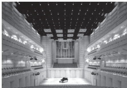
Két „cipődoboz”: a lipcei Alte Gewandhaus és a dortmundi Konzerthaus

Hamburgban 1908. június 4-én avatták fel ünnepélyes körülmények között a Laeiszhalle-t. Eredetileg Németország legnagyobb és legmodernebb hangversenyterme volt, amely azóta zenetörténetet írt: Richard Strauss, Sergej Prokofjev és Igor Sztravinszky lépett fel; a zongorista Vladimir Horowitz élte meg itt nagy debütálását, és a tizenkét éves hegedős Yehudi Menuhin váltott ki a közönségből valóságos lelkesedési hullámot. A második világháború után, amit a ház sértetlenül túlél, a Laeiszhalle egy szokatlan intermezzót élt át: a brit megszállók a helyiségeket átmenetileg a BFN katonai adó épületeként használták.