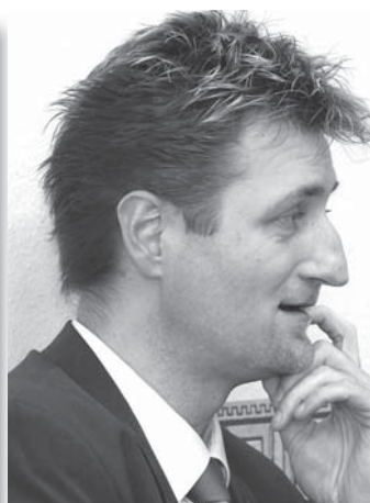
Mérei Tamás Savaria Szimfonikus Zenekar