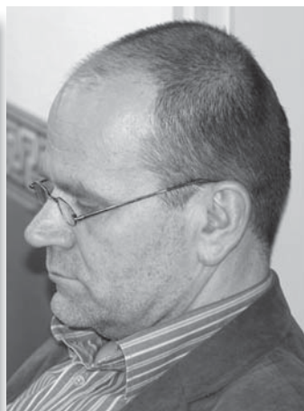
Gyüdi Sándor Szegedi Szimfonikus Zenekar